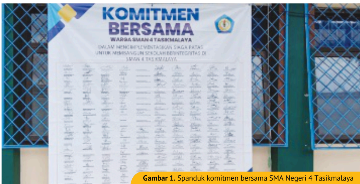
Gambar 1. Spanduk komitmen bersama SMA Negeri 4 Tasikmalaya

positif yang dijalankan. Budaya apresiasi akan pencapaian prestasi murid pun terdorong muncul ketika setiap prestasi murid dimasukkan dalam Siaga Patas dan tentu saja diketahui oleh warga sekolah sebagai pencapaian bersama. Setelah satu tahun implementasi Siaga Patas, Nizar melihat adanya perubahan yang signifikan dalam budaya sekolah. Murid mulai bertanggung jawab atas perilaku mereka, wali kelas mendapatkan data lengkap untuk program pendampingan wali kelas dan orang tua murid juga turut dalam penguatan karakter baik putra/putrinya.