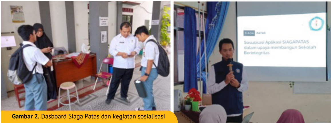
Gambar 2. Dashboard Siaga Patas dan kegiatan sosialisasi

Dengan memanfaatkan teknologi lewat Siaga Patas, sekolah telah berhasil menjadikan disiplin sebagai bagian dari kebiasaan sehari-hari murid. Pengembangan platform digital Siaga Patas menjadi contoh praktik digitalisasi yang diharapkan dapat menginspirasi sekolah-sekolah lain. Komitmen untuk menciptakan lingkungan belajar yang berbudaya disiplin positif dan mendukung pendidikan karakter menjadi langkah penting dalam mempersiapkan murid untuk masa depan.