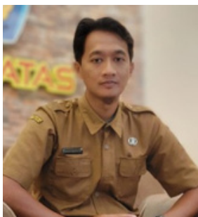
Foto dan Profil Kontributor

Dengan memanfaatkan teknologi lewat Siaga Patas, sekolah telah berhasil menjadikan disiplin sebagai bagian dari kebiasaan sehari-hari murid. Pengembangan platform digital Siaga Patas menjadi contoh praktik digitalisasi yang diharapkan dapat menginspirasi sekolah-sekolah lain. Komitmen untuk menciptakan lingkungan belajar yang berbudaya disiplin positif dan mendukung pendidikan karakter menjadi langkah penting dalam mempersiapkan murid untuk masa depan.